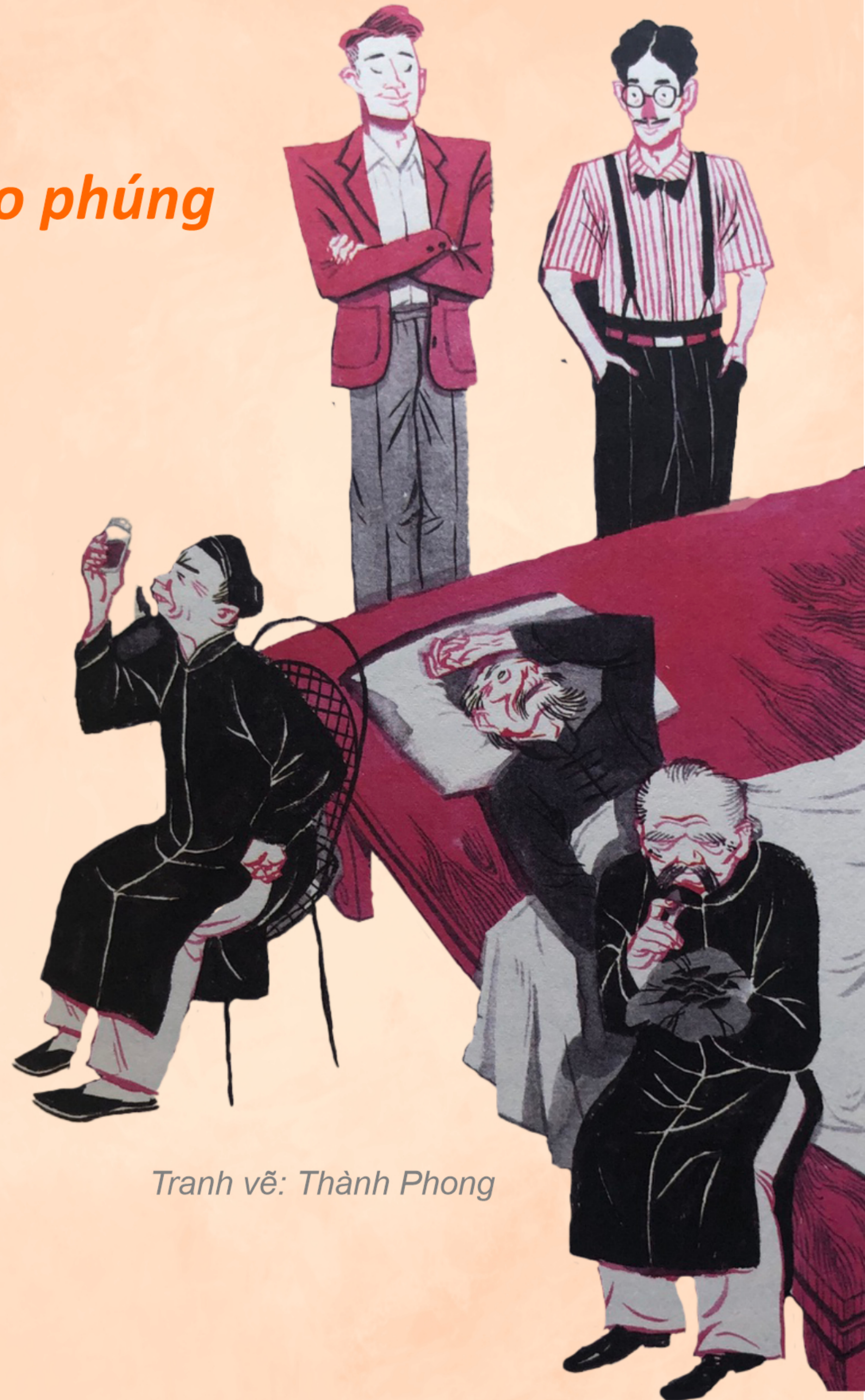
Tranh vẽ: Thành Phong