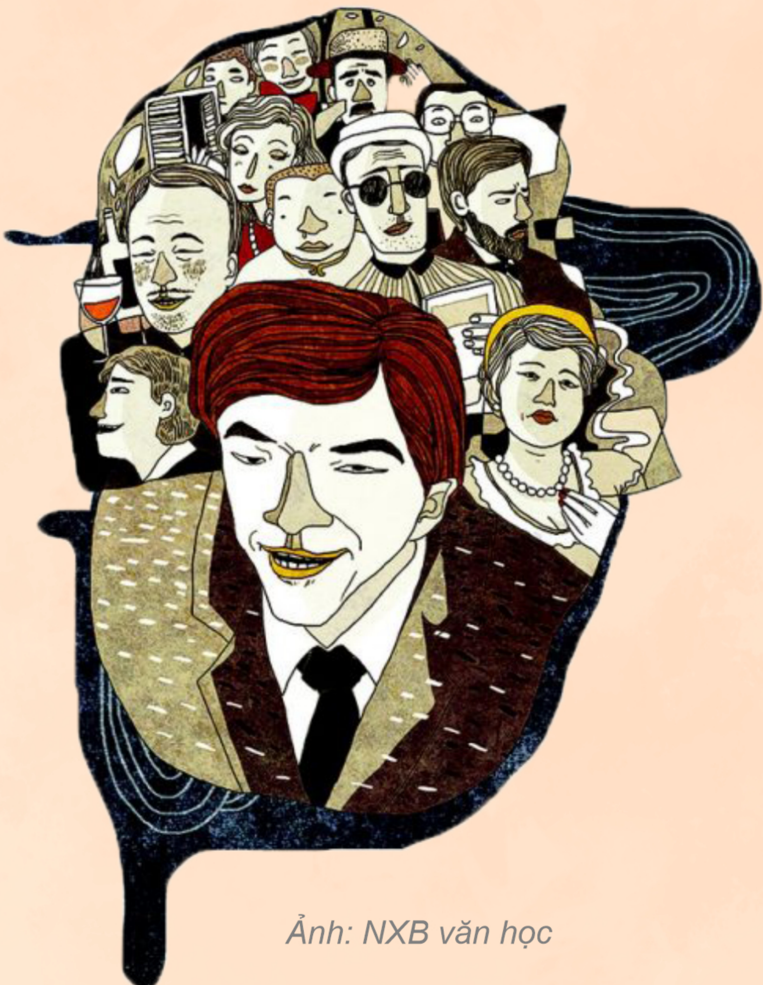
Ảnh: NXB văn học