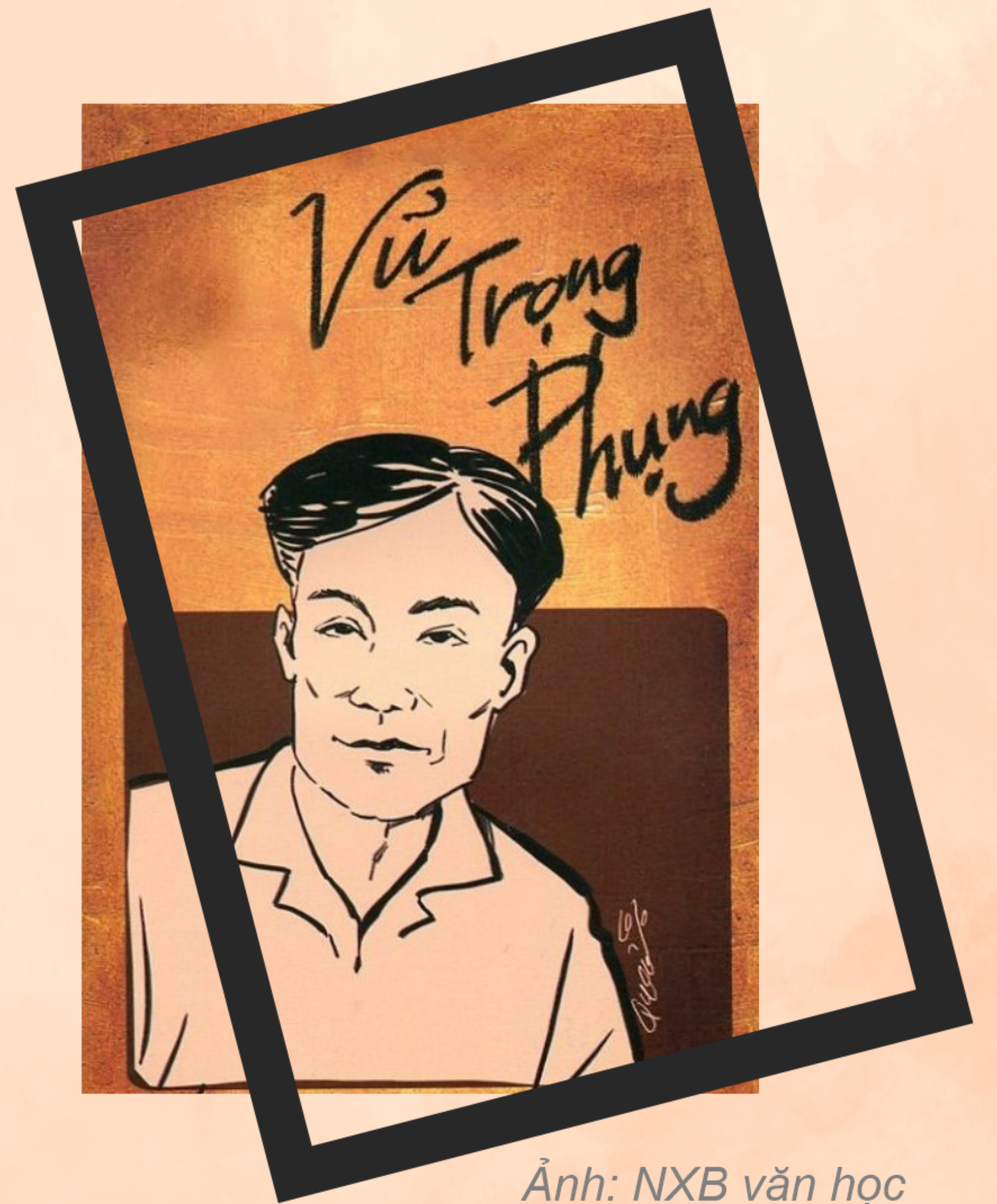
Ảnh: NXB văn học