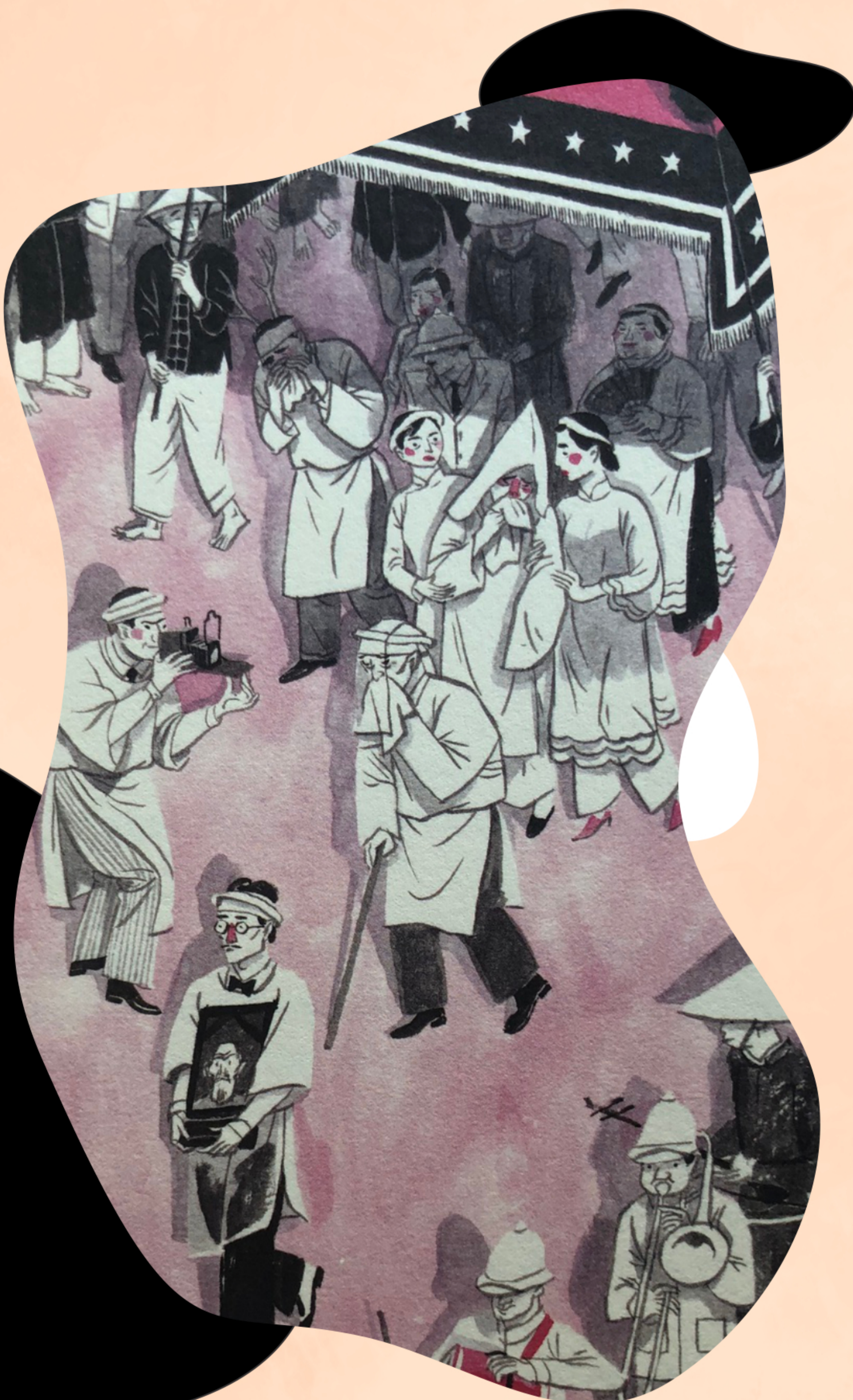
Tranh vẽ: Thành Phong